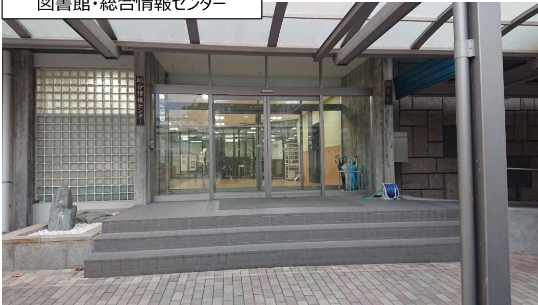
図書館・総合情報センター