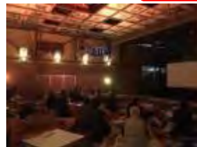
こたつシアター寄井座