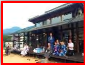
えんがわオフィス